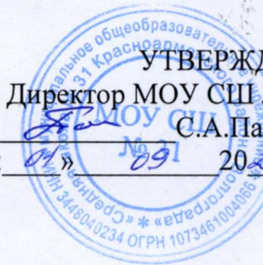
ГРАФИК работы учителя-дефектолога МОУ СШ № 31 на 2022/2023 учебный год