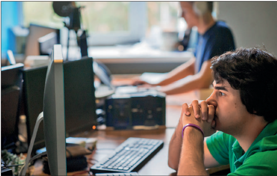
Постоянное присутствие вербовщиков ИГИЛ в соцсетях.

Активисты ИГИЛ поддерживают свои аккаунты в сетях Facebook, Twitter, Instagram, Friendica, Telegram. Активно они заявили о себе и в российских социальных сетях: «ВКонтакте» и «Одноклассниках».