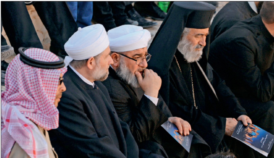
Представители различных конфессий объединились против ИГИЛ. На концерте симфонического оркестра петербургского Мариинского театра в Римском амфитеатре сирийской Пальмиры, освобожденной от террористов ИГИЛ.

В последнее время появилось значительное число верующих, причисляющих себя к крайним религиозным течениям (в СМИ упоминаются как «салафиты», «хариджиты», «ваххабиты»). Однако костяк ИГИЛ составляют лишь люди, причисляющие себя к ультрарадикальному крылу вышеназванных течений.