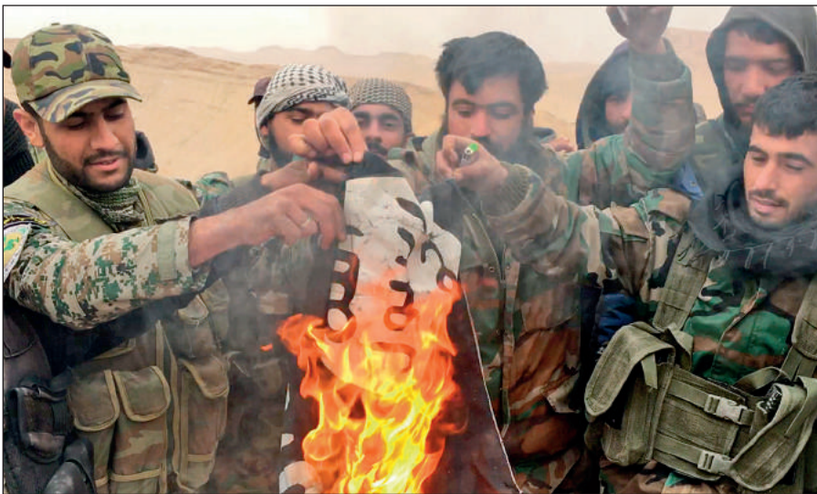
Народные ополченцы САР сжигают флаг ИГИЛ, снятый с отбитой у боевиков цитадели Пальмира.

Современное государство обязано защищать интересы каждого своего гражданина вне зависимости от его расы, национальности, принадлежности к определенной конфессии или религиозной традиции, в то время как ИГИЛ выражает интересы небольшой группы религиозных радикалов, жестоко подавляя остальную часть населения посредством запугивания, насилия и террора.