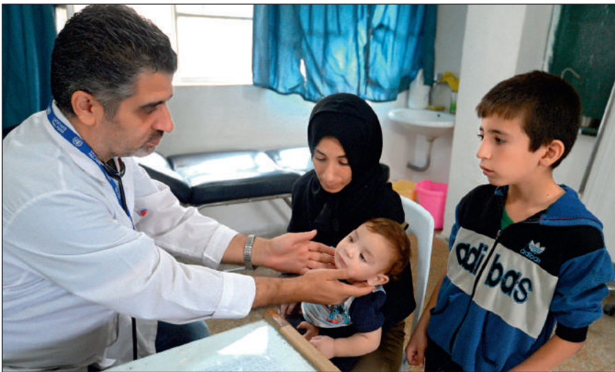
Истинный ислам призывает к состраданию и милосердию. Врач осматривает ребенка в медицинском пункте лагеря при одной из школ Дамаска.

Радикалы объявляют «врагами ислама» всех несогласных с ними мусульман. Ультрарадикальные группировки признают террор и насилие единственным способом достижения провозглашенных ими целей.