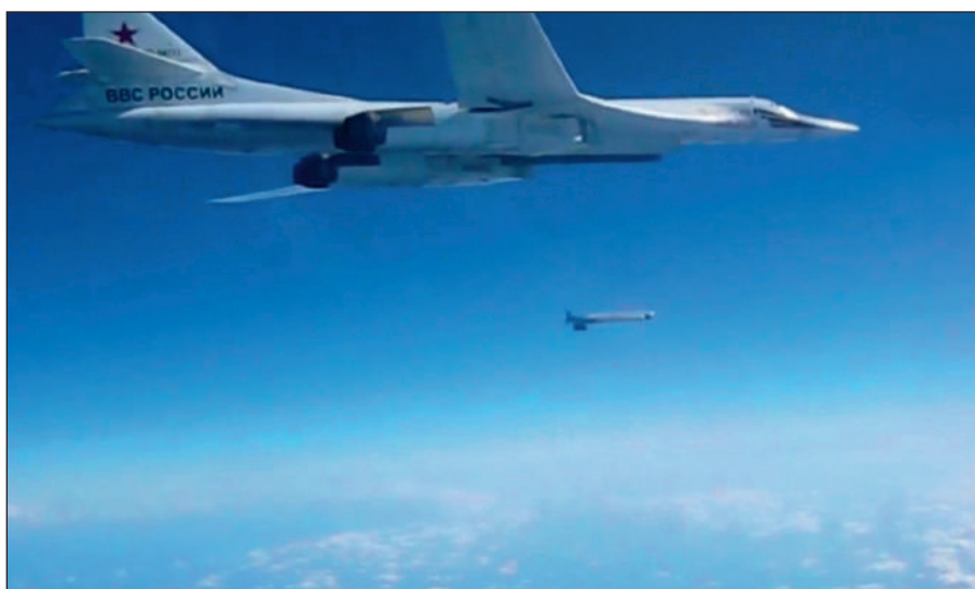
Воздушная операция российских ВКС по уничтожению боевиков ИГИЛ в Сирии.