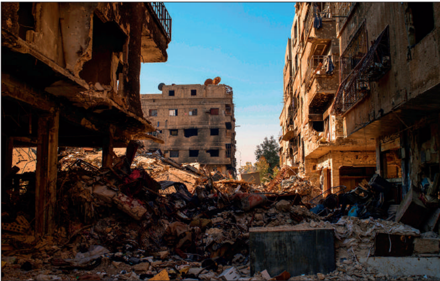
Разрушенный боевиками ИГИЛ Дамаск.

Террористы поставили на поток производство видеороликов с жестокими сценами казней пленников, заложников и «вероотступников». Эти материалы потом широко распространяются в социальных сетях и