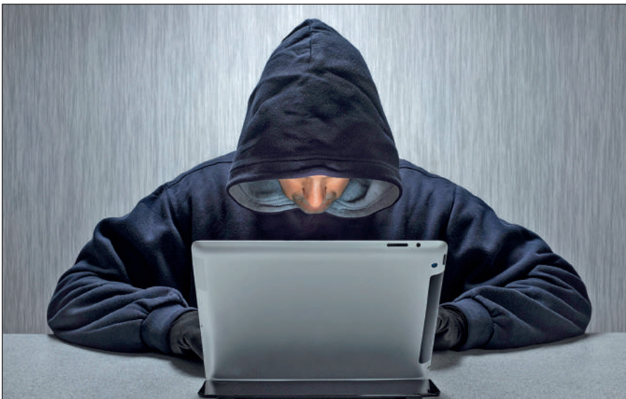
Вербовщики ИГИЛ активно используют Интернет.

Террористы день ото дня совершенствуют методы вербовки новых сторонников, а также алгоритмы их идеологической обработки. Читателю стоит помнить, что те типовые ситуации, которые описаны в данном пособии, можно рассматривать лишь в качестве базовых ориентиров,