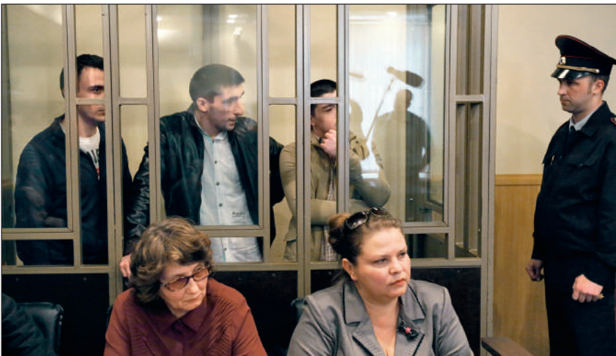
В Российской Федерации предусмотрена административная и уголовная ответственность за пропаганду идей терроризма, участие в деятельности террористических организаций.