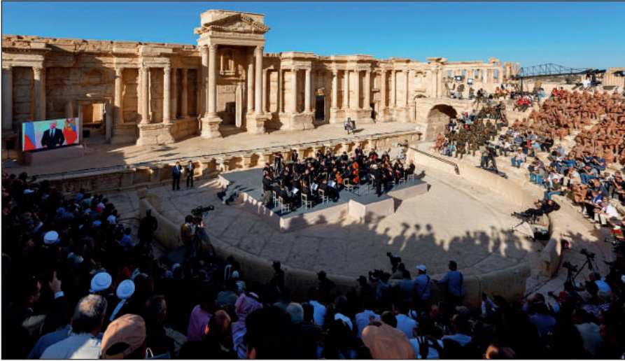
Освобожденная Пальмира. На концерте симфонического оркестра петербургского Мариинского театра под руководством народного артиста России Валерия Гергиева в Римском амфитеатре сирийской Пальмиры, освобожденной от террористов ИГИЛ.