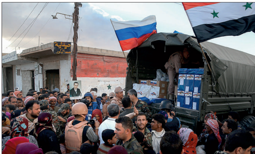
Россия оказывает гуманитарную помощь Сирии.