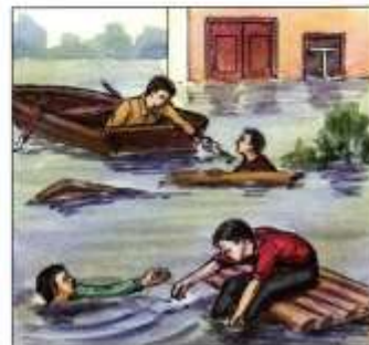
Оказывать срочную помощь людям, очутившимся в воде