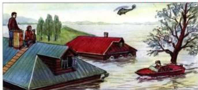
Спасти людей, где бы они ни оказались, используя для этого любые средства