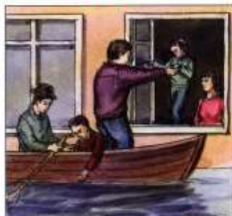
В первую очередь из зоны затопления выводить детей