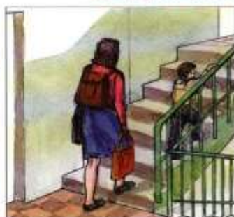
Перенести на верхние этажи продовольствие, ценные вещи, одежду, обувь